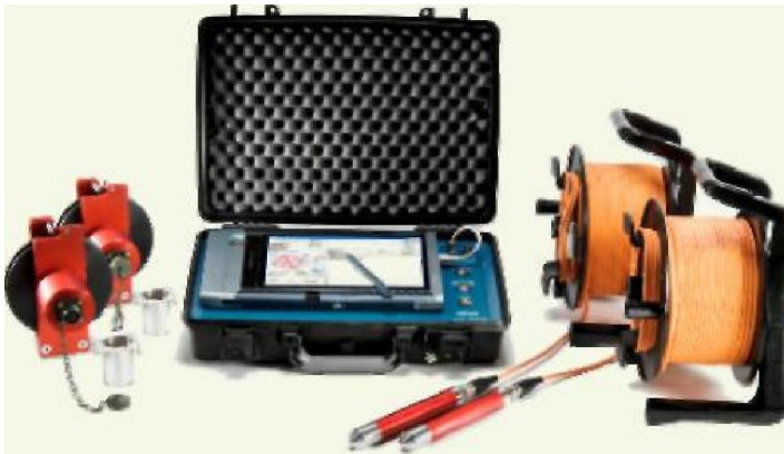
Система CHUM (компьютер в комплект не входит)

Система использует ультразвуковые волны, посылаемые от излучателя к приемнику, в то время как они находятся в заполненных водой трубках расположенных внутри бетонной конструкции. Измеренное время распространения и амплитуда сигнала напрямую зависят от качества бетона. Система CHUM также поддерживает другие методы контроля: 2D и 3D томография, метод Single Hole Ultrasonic Testing (SHUT)